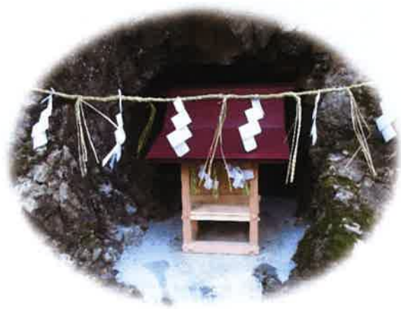
スコボシ(亀島)地籍の旧波田堰取入口に祠ってある水神様