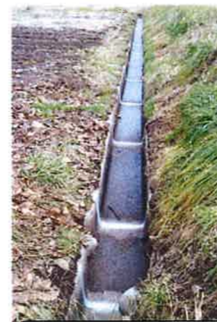
目地補修 (水沢田地区)

波田堰土地改良区が平成26年度から参画し活動している波田地区地域資源保全活動組織では、多面的機能支払交付金制度を使って、農業用排水路等の改良区施設の補修工事等を実施しています。平成27年度は目地補修、水路敷設替え等を実施しました。