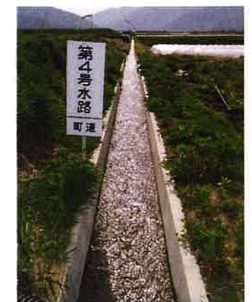
水路敷設替え (4号水路)