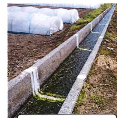
目地補修 (開田地区)