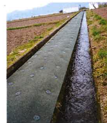
防草シート設置(開田)