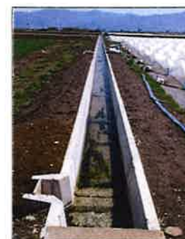
適正化事業 水路敷設替え(2-1・2-2号線)

波田堰土地改良区が平成26年度から参画し活動している波田地区地域資源保全活動組織では、多面的機能支払交付金制度を使って、農業用排水路等の改良区施設の補修工事等を実施しています。平成29年度は目地補修、水路の漏水改善工事等を実施しました。