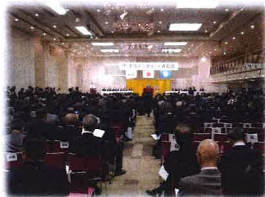
表彰式 於：東京永田町 シェーンパッサ・サボー