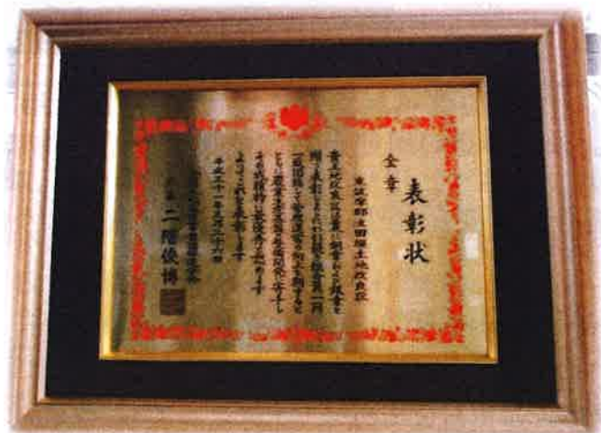
全国土地改良功労者等表彰 金章表彰状