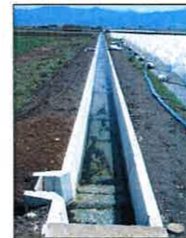
適正化事業 水路敷設替え(2-1・2-2号線)

波田堰土地改良区が平成26年度から参画し活動している波田地区地域資源保全活動組織では、多面的機能支払交付金制度を使って、農業用排水路等の改良区施設の補修工事等を実施しています。平成29年度は目地補修、水路の漏水改善工事等を実施しました。