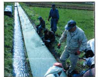
防草シート設置(開田)