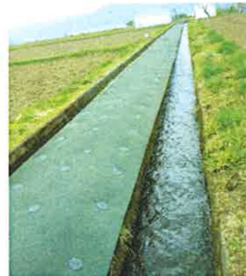
防草シート設置（開田）