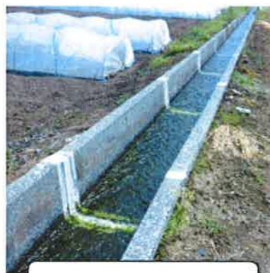
目地補修 (開田地区)