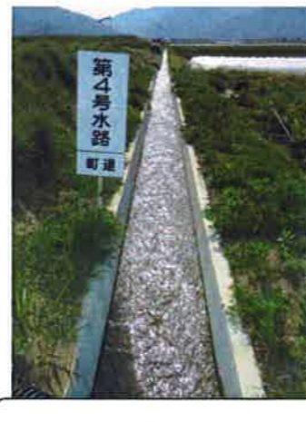
水路敷設替え (4号水路)