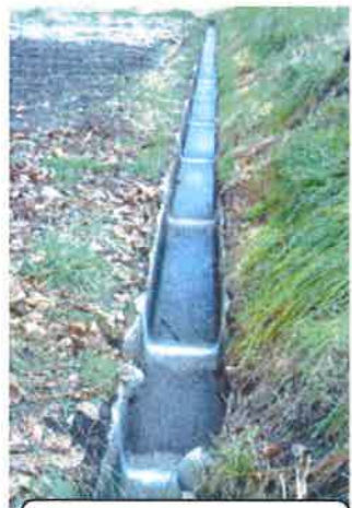
目地補修 (水沢田地区)

波田堰土地改良区が平成26年度から参画し活動している波田地区地域資源保全活動組織では、多面的機能支払交付金制度を使って、農業用排水路等の改良区施設の補修工事等を実施しています。平成27年度は目地補修、水路敷設替え等を実施しました。