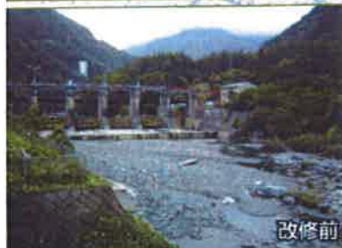
昭和25年完成の旧梓川頭首工