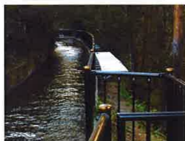
波田堰補修工事 (平成25年度実施)