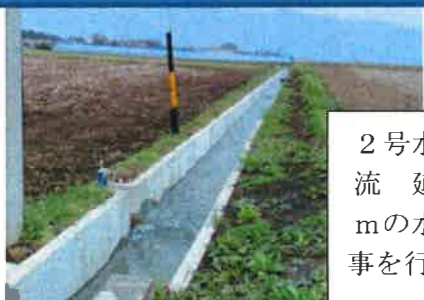
2号水路最上流より東を望む