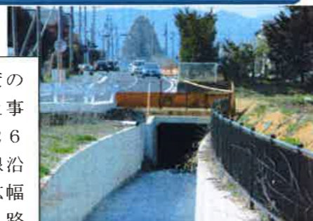
2-1号水路より南を望む

波田地域の排水対策の一環として始まった事業ですが、2年目の26年度は市道98号線沿いの1カ所で道路拡幅工事とともに水路改修が行われました。