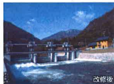
平成20年完成の現梓川頭首工