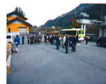
(頭首工見学の様子)