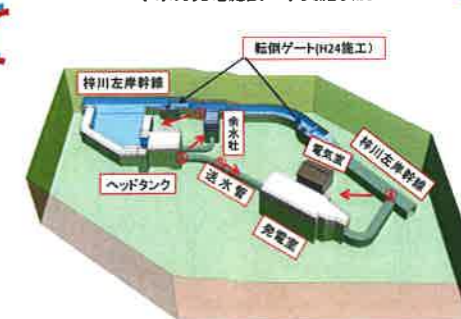
小水力発電施設工事実施状況