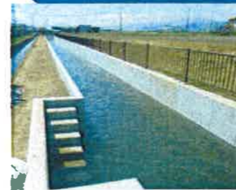
2-2号水路から南を望む

平成25年度～29年度事業 波田地域の排水対策の一環として始まった事業ですが、初年度は市道98号線沿いの2カ所で工事が行われました。