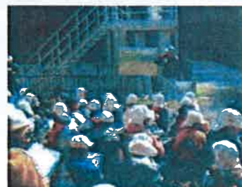
梓川頭首工での説明

11月5日・7日の2日に分かれて波田小学校の4年生の校外学習があり、波田堰の旧取入口(すこぼし)、梓川頭首工、上海渡分水工を見学しました。当日は、国営の江上所長を始め事業所の方、中信平連合の方々にお世話になりました。