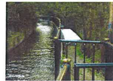
（新しい防護柵と管理道）

上渡分水工から水沢田までの管理用通路の一部崩落、防護柵の老朽化が著しかった為、安全面の確保から本事業により管理用通路の新設及び防護柵の更新をしました。あわせて、水路の老朽化による表面被覆工事も行いました。