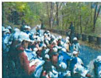
旧取入口での様子