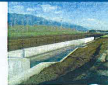
6号水路より北を望む

和田道よりJA松本ハイランドすいか選果場の南までの区間の市道拡幅(歩道設置)に伴い排水路の移設工事を行いました。